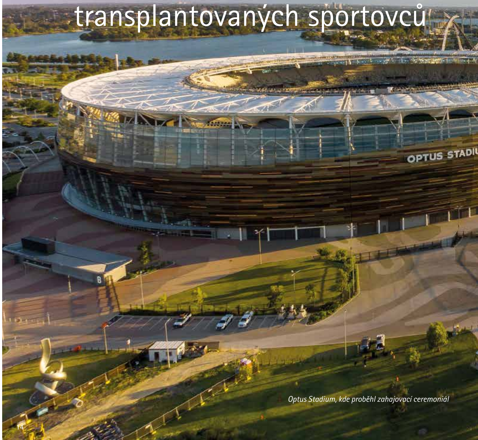
Optus Stadium, kde proběhl zahajovací ceremoniál