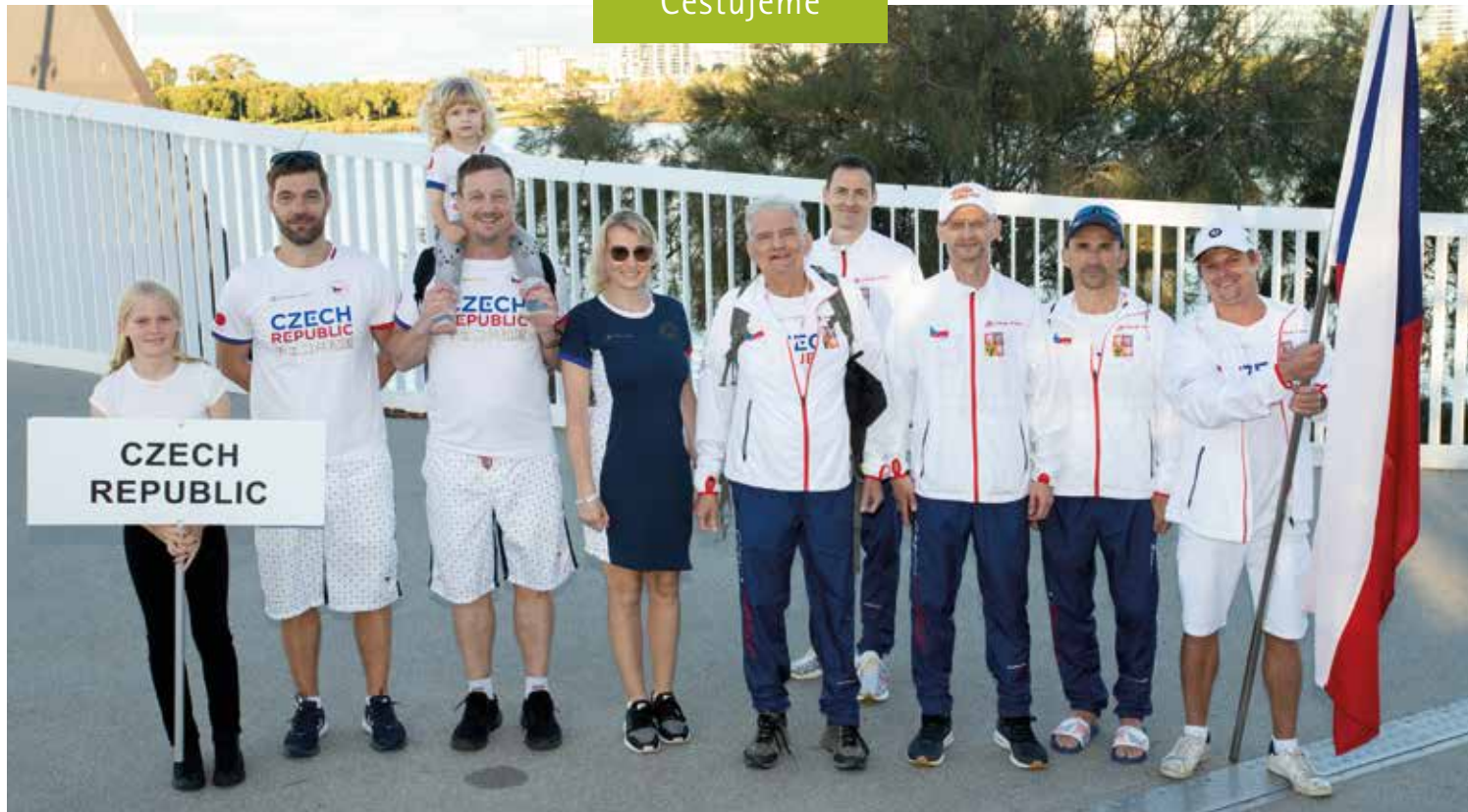
Česká výprava s doprovodem nejbližších před nástupem na Optus Stadium

hlavním plánovačem cesty, ale samozřejmě strávil obrovský počet hodin badmintonovou a atletickou přípravou. Navíc měl již veškeré náklady na tuto dlouhou cestu uhrazené.